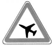
traversée d'une aire de danger aérien