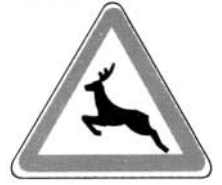
passage d'animaux sauvages