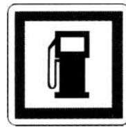
poste de distribution de carburant