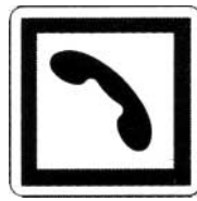
poste d'appel téléphonique