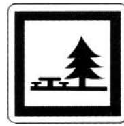
emplacement pour pique-nique