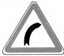
virage à droite