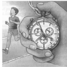
Le chronomètre mesure le temps.

un chrétien (NOM) Personne qui croit que Jésus-Christ est le fils de Dieu. Les protestants et les catholiques sont des chrétiens. ► Un chrétien, une chrétienne. ► Chrétien se prononce [kʁetjɛ̃] : regarde page 12.