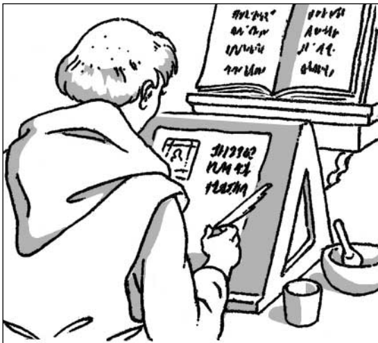
Autrefois, les livres étaient recopiés à la main par les moines.