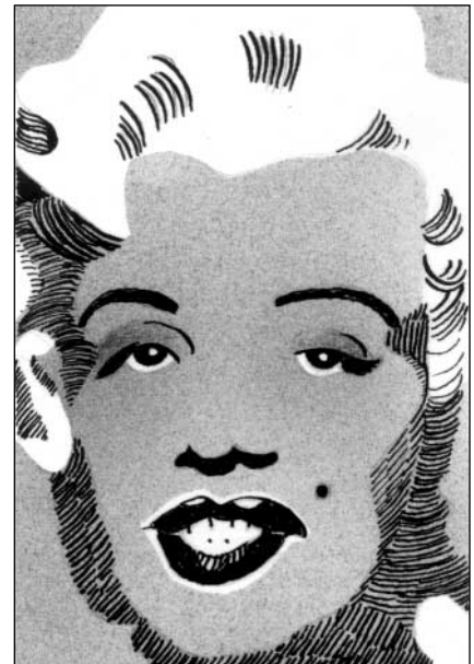
D'après Andy WARHOL, Marilyn Monroe , 1964.