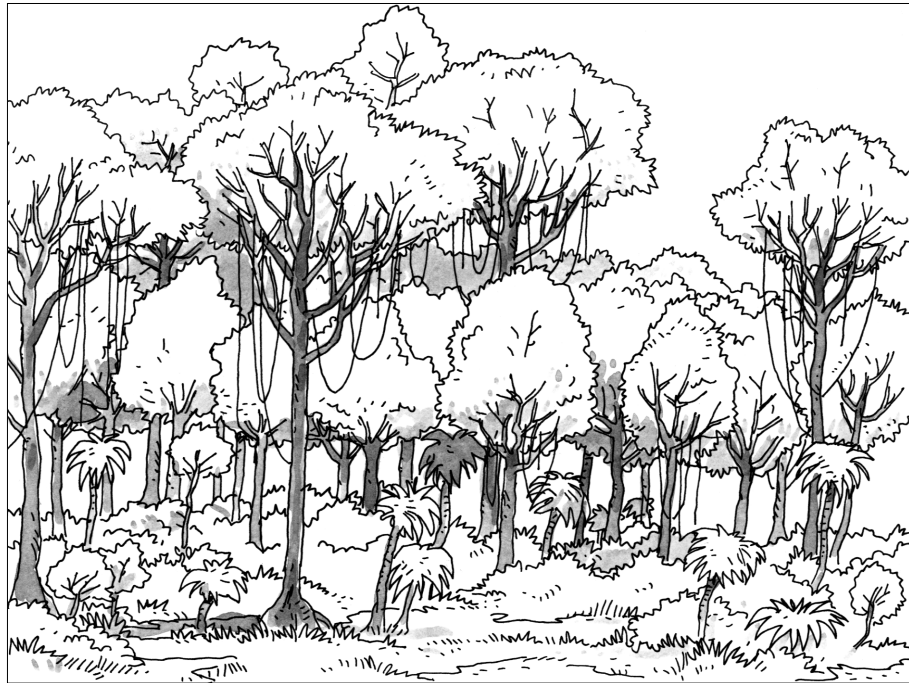
Les étages de la végétation dans la forêt tropicale